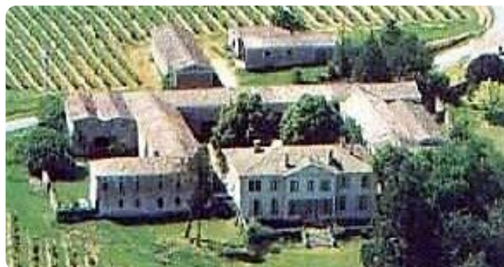
Vue du Château Laroque - Bordeaux - France

Depuis plusieurs années le Château Laroque, situé en banlieue de Bordeaux en France, est devenu le centre international du Kundalini Yoga Tantra. Plusieurs stages à différents niveaux sont offerts tout au long de l'année.